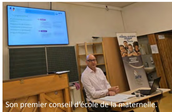
Son premier conseil d'école de la maternelle.