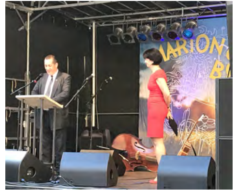
Fellbach 14 juillet 2023