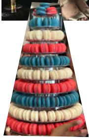
Stuttgart 14 juillet 2023